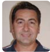
FERDINANDO DE GIORGI Allenatore