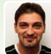
6 SAMUELE PAPI Schiacciatore - 20/05/1973 - 191 cm Undicesima stagione in maglia Sisley Treviso