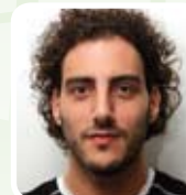
3 ALESSANDRO FEI Opposto - 29/11/1978 - 204 cm Terza stagione in maglia Sisley Treviso